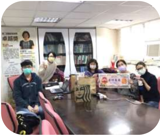
長庚護理研究所-專案成果討論 (獎卿大台北居家護理所)