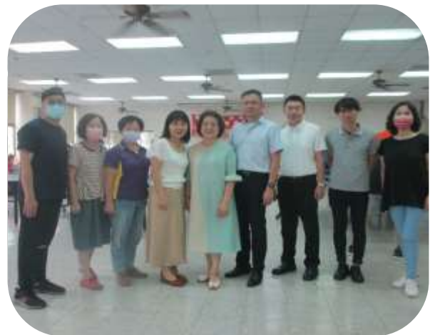
交通部官員參訪社區據點 (楠梓老人福利服務中心)