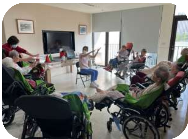
護理之家-住民慶生活動