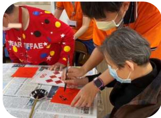
文山-過年春節賀新春