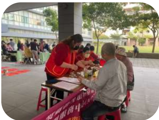
護理之家-春節揮毫