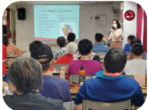
台北居服-居服員教育訓練