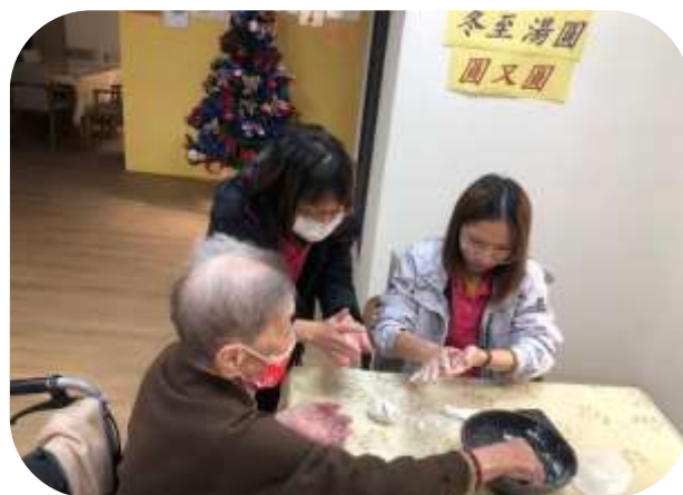
苓雅日照-冬至湯圓圓又圓