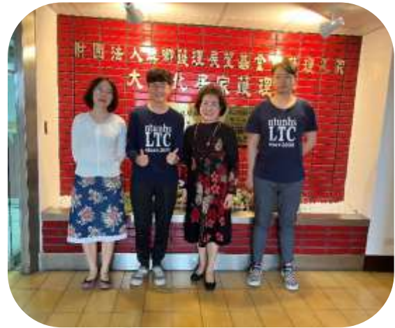
國立臺北護理健康大學實習 (獎卿大台北居家護理所)