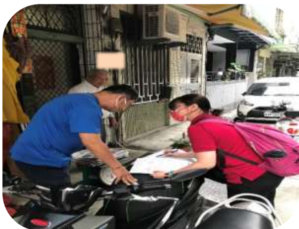
社區整合型服務中心-個管員訪視