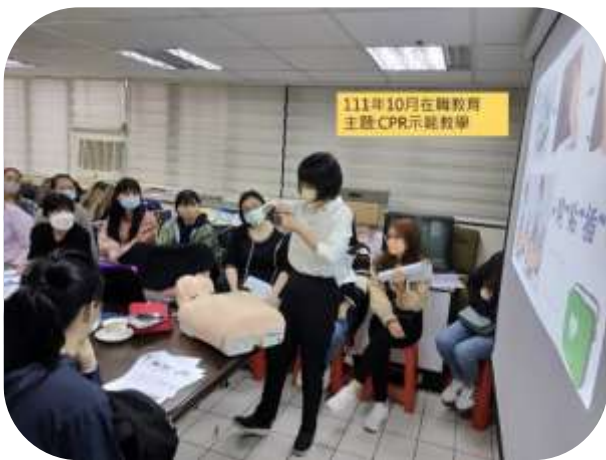
台北特聘-在職教育 CPR 教學