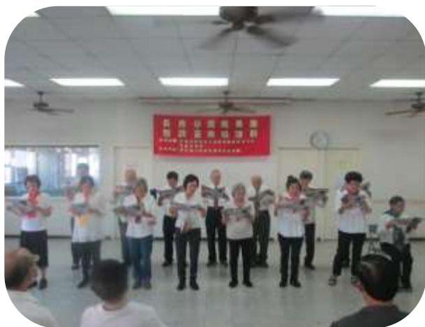
楠梓-學苑成果展暨跳蚤市場