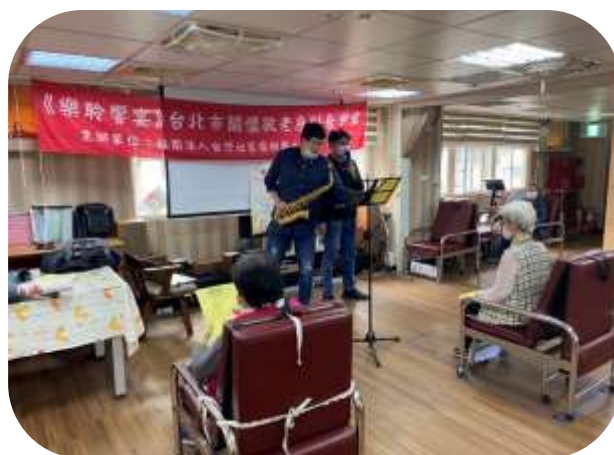
文山-台藝協會現場表演