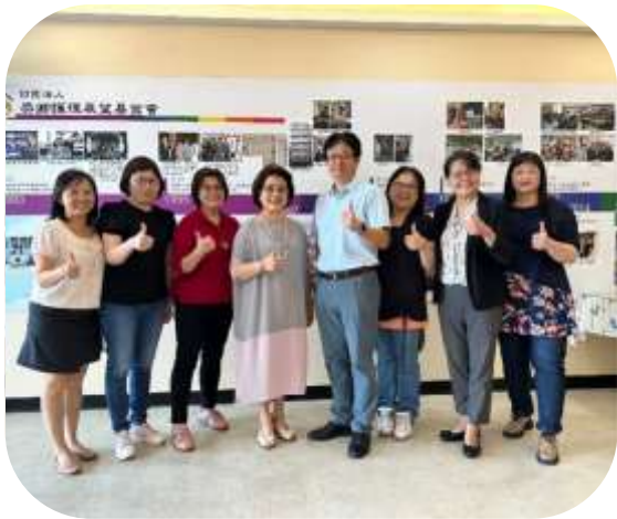
高雄彰秀護理之家及台南市立醫院參訪 (獎卿護理之家)