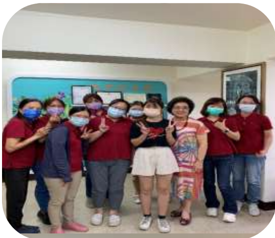
育英老人服務事業管理科實習