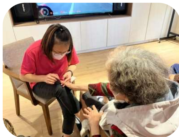
苓雅日照-指甲彩繪