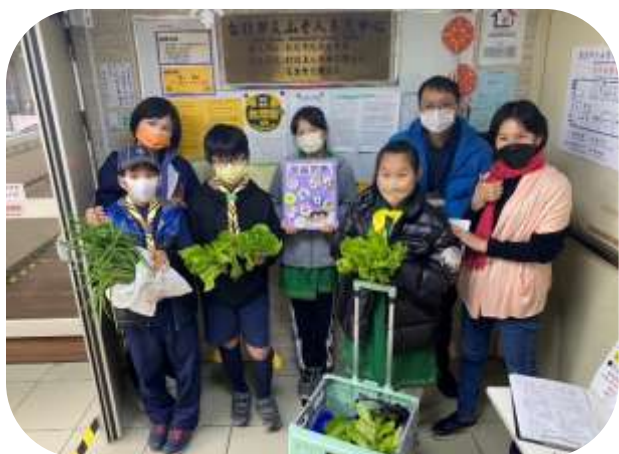
文山-興德國小師生贈送有機蔬菜