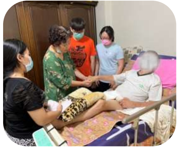
長庚研究生-居家指導肢體按摩