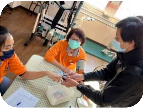
文山-儀器設備教育訓練