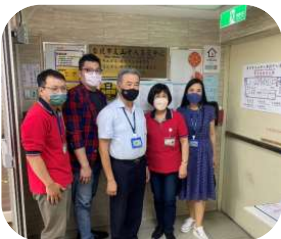
靜心學校財團法人參訪 (文山養護中心)