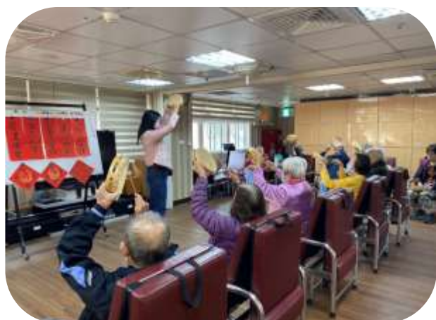
文山日照-音樂輔療