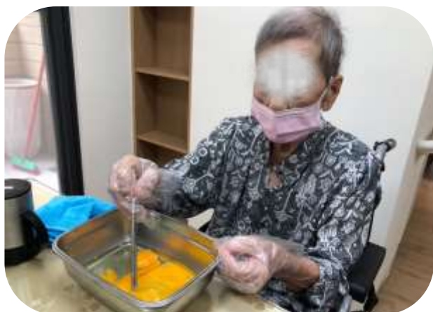
苓雅日照-烹飪教室法國吐司