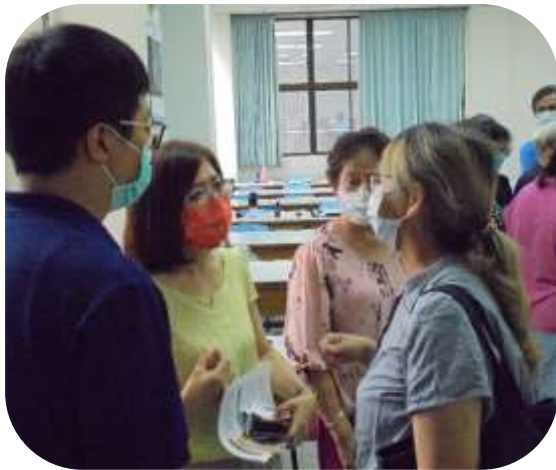
高雄市社會局長官參訪 (楠梓老人福利服務中心)