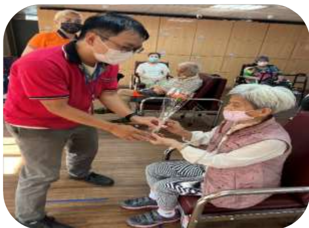
文山-重陽節活動贈送長者花束