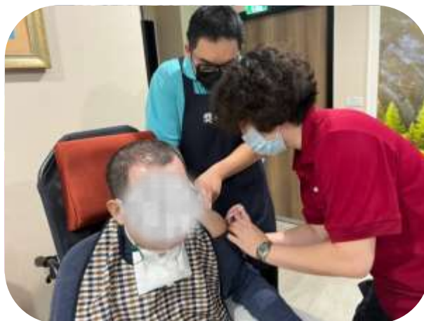
護理之家-流感疫苗接種