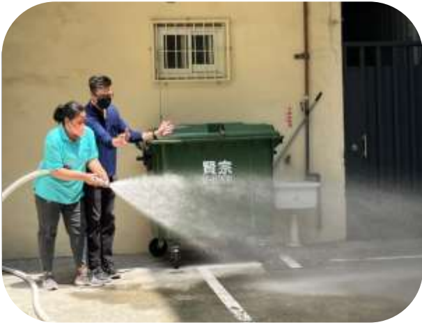
護理之家-消防演練