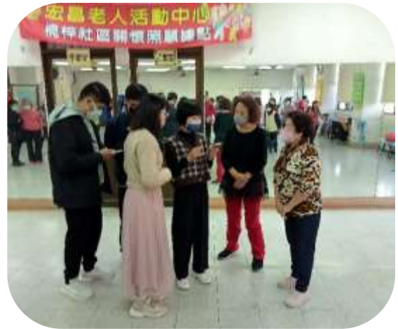
高雄大學運動健康休閒系參訪 (楠梓老人福利服務中心)