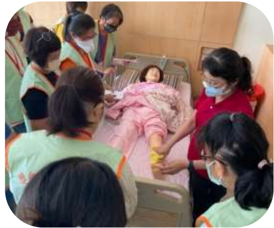
凱旋醫院-照顧服務員實習