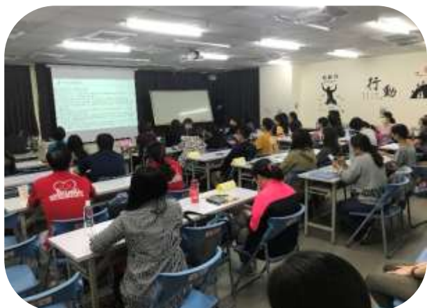
三民分區-A 聯繫會議