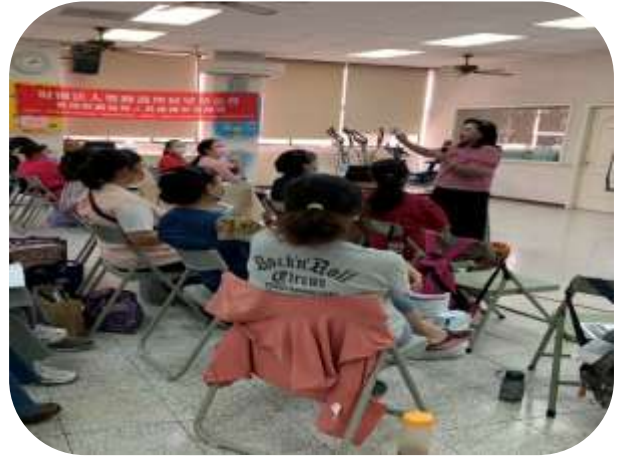
左營居家服務-原住民課程