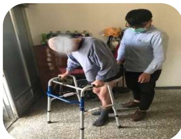
社區整合型服務中心-個管員專業服務共訪