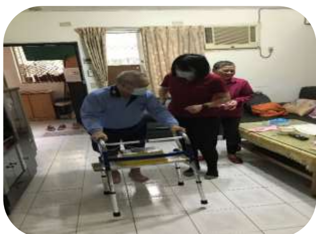
社區整合型服務中心-個管員居家評估