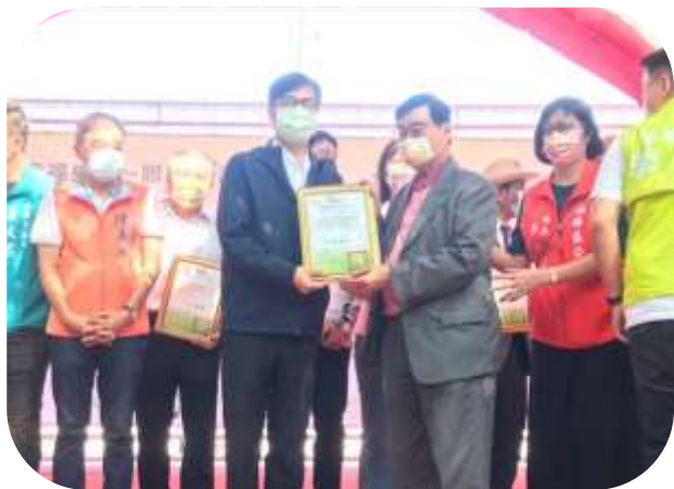
楠梓-重陽節活動市長致贈感謝狀