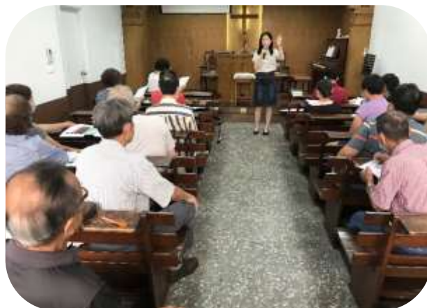
主任至社區教會做長照宣導