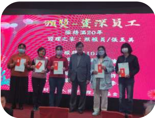
111 年護理之家、左營居家服務-服務屆滿 20 年及 10 年資深人員