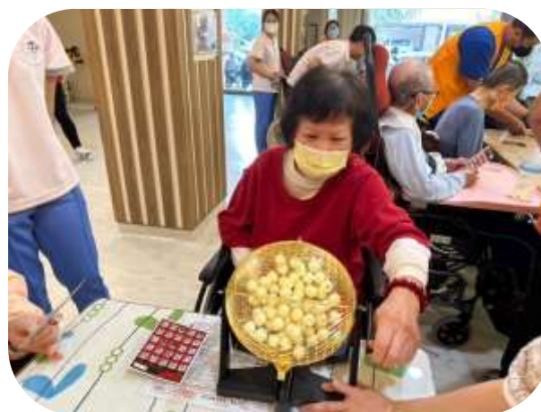
護理之家-方舟慈善天使團-賓果樂