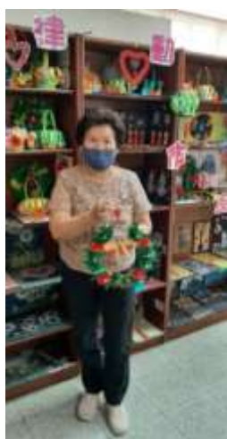
據點手工藝活動- 製作花圈

衛福部因應高齡化社會，提前部署，建立優質、平價、普及的長照服務體系，需要大量的人力投入里、社區活動中心，同時提供預防性與支持性的各項服務，以維持健康、預防或延後發生衰弱現象，帶動社區中銀髮生命的新動力與生活品質，獎卿基金會成立關懷據點，落實服務長輩的需求，我也在社工大力鼓勵下，接受不同的培訓課程，充實自己，有了種子教師和生活輔導員證照後，正式投入關懷據點服務，服務內容甚廣，中心有送餐服務，有動靜態教學，有獨居訪視，更有老人共餐，兼顧長輩的營養需求，也藉著銀髮族群同儕間鼓勵的力量，讓身處居家的長輩願意從家中走出來社區一同參與活動。