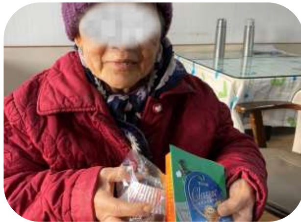
文山-與靜心小學慶耶誕