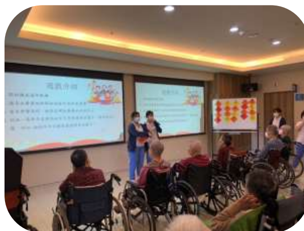
護理之家-春節團體活動