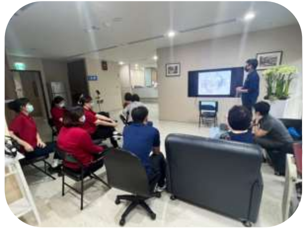
護理之家-性騷擾教育訓練