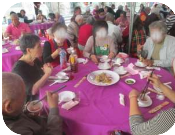
楠梓-獨居長輩圍爐