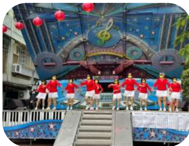
楠梓-寒冬送暖活動據點長輩表演