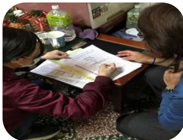
社區整合型服務中心-個管員解說輔具申請流程