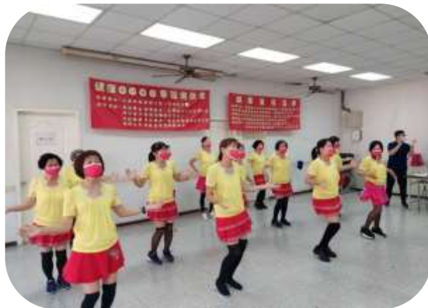
楠梓-健康宣傳活動據點長輩表演