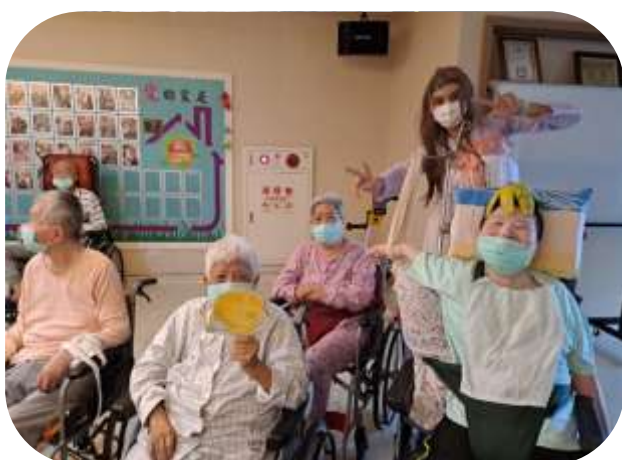
護理之家-中秋節慶祝活動