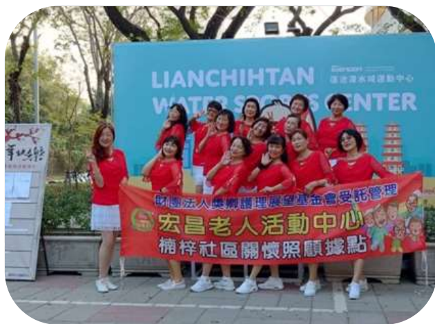
楠梓-高雄燈會表演合照