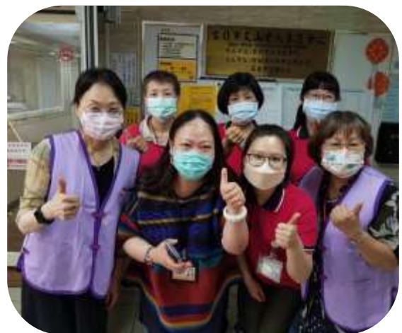
台北護理師護士公會參訪 (文山養護中心)