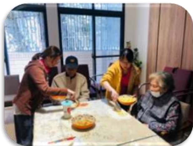
苓雅日照-烹飪教室