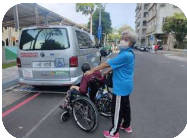
左營居家服務-陪伴就醫