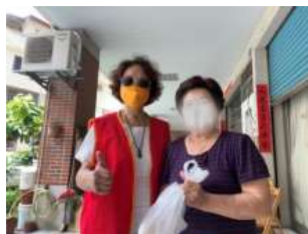
蔣志工與阿嬤合照