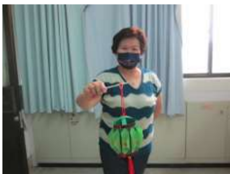
據點手工藝活動-製作元宵燈籠