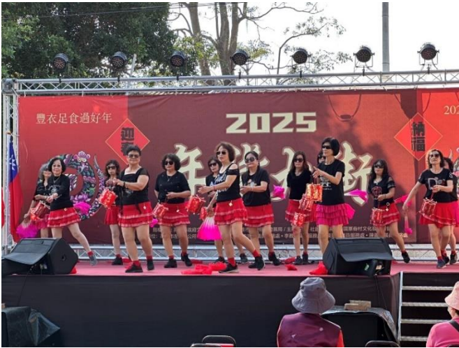
楠梓- 2025 左營年貨大街 活動表演