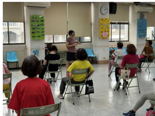
老師講解運動的原理