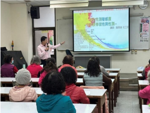
楠梓-性平別等講座：瞭解性與性別