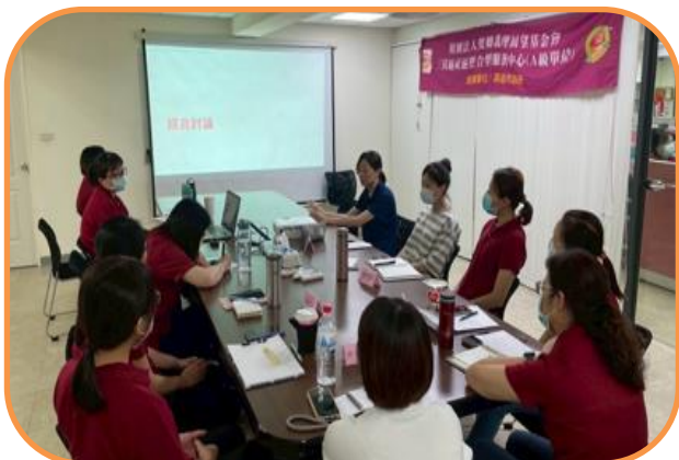
社區整合型服務中心 A 單位 跨專業個案討論會