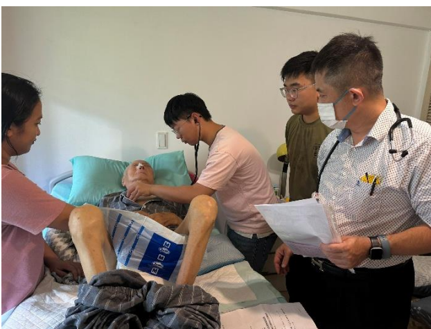
中心診所-PGY 實習家訪 (臺北居家護理)