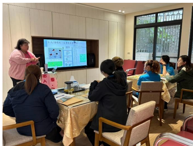
台灣受恩社區長照機構