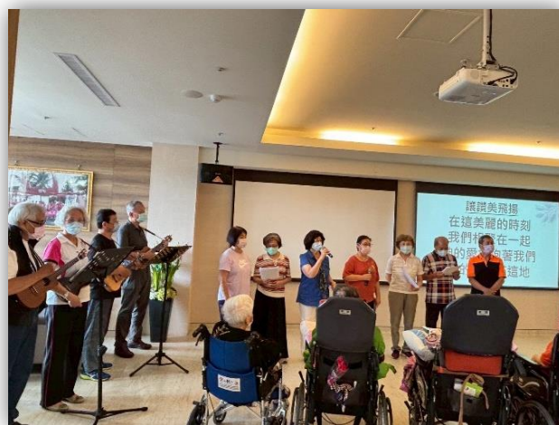
護理之家-母親節活動