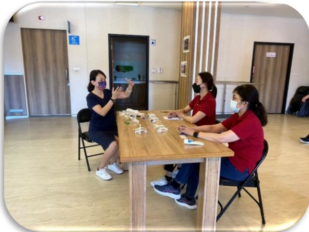
高雄居家護理-氣切換管