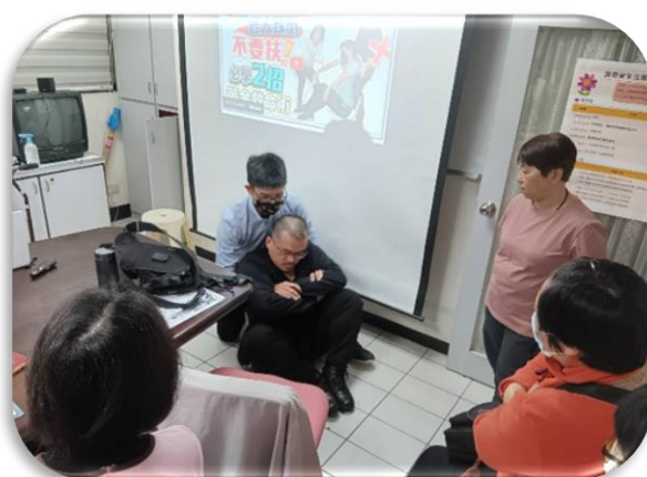
台北居服-防跌. 輔具. 轉移位