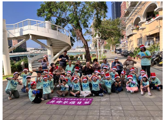
苓雅日照-武昌教會但以理學院報佳音