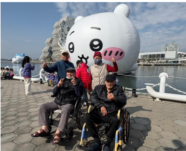
苓雅日照-吉依卡哇展