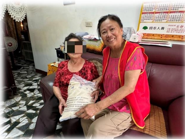
楠梓-贈送獨居米糧