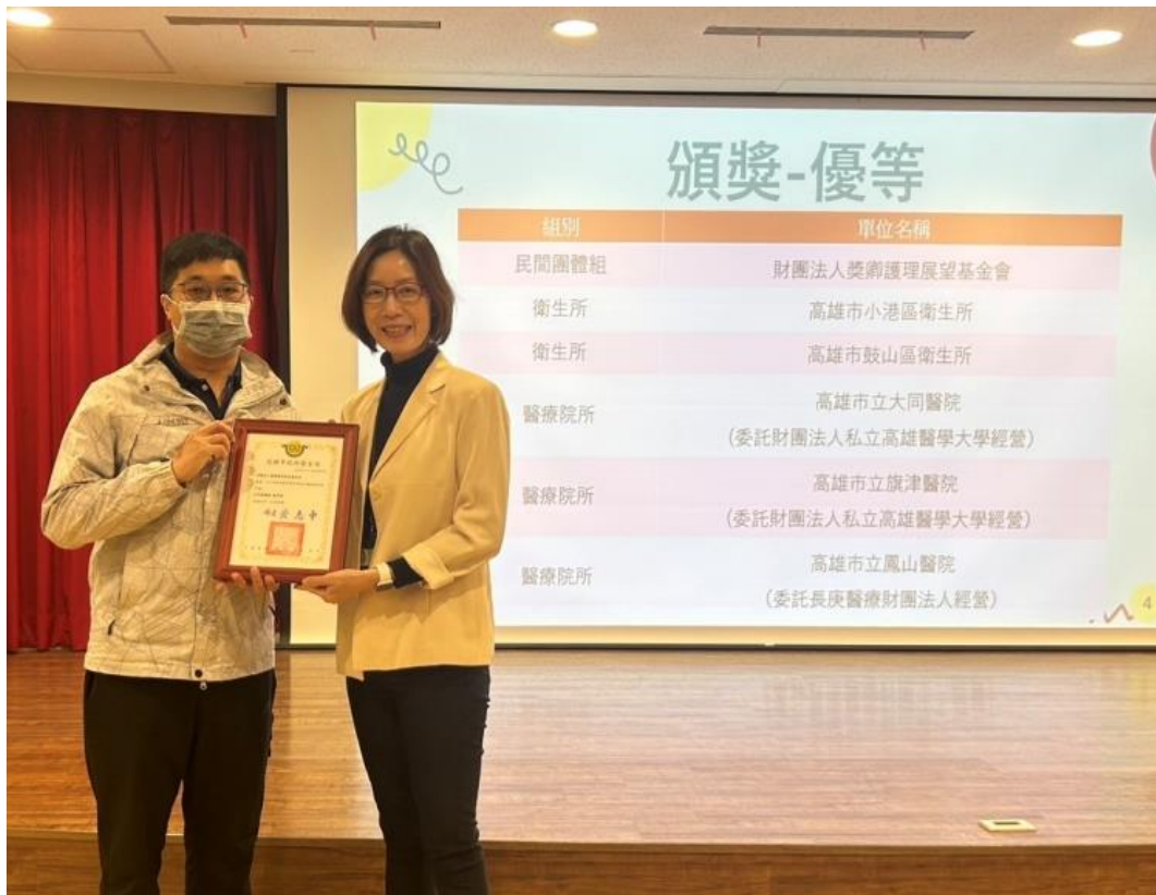
楠梓老人福利服務中心_高雄市政府衛生局衛生保健業務志工團隊『優等』