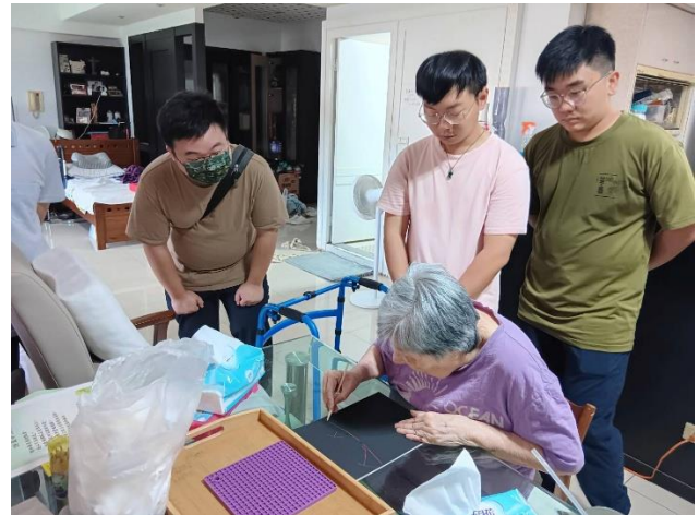
中心診所-PGY 實習 (臺北居家服務)