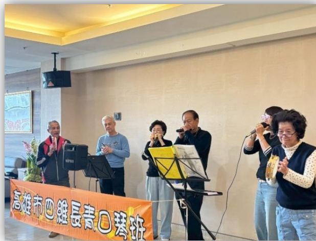
護理之家-長青口琴班表演