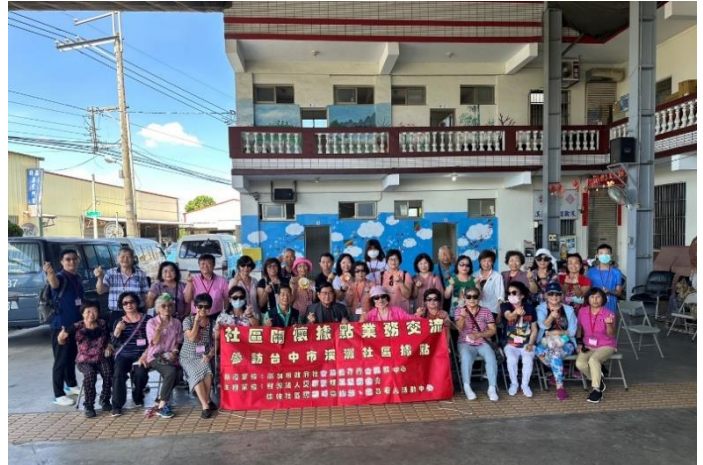
楠梓-參訪台中市溪洲社區照顧關懷據點