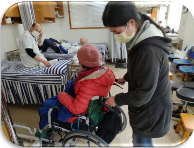
台北居服職前教育-輪椅使用