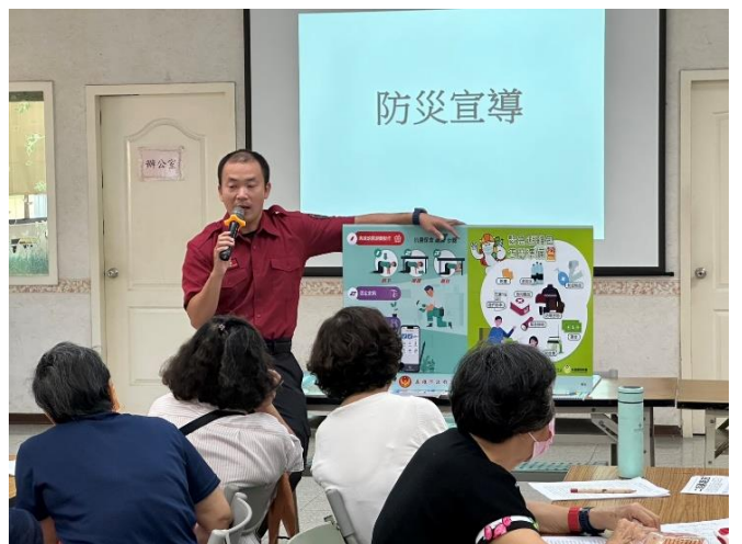
楠梓-志工教育訓練 中心防災宣導