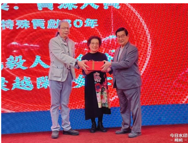
特殊貢獻獎：鵬毅人力仲介公司合作 30 年