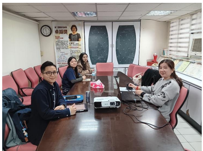
陽明交通大學護理研究所實習 (臺北居家護理)