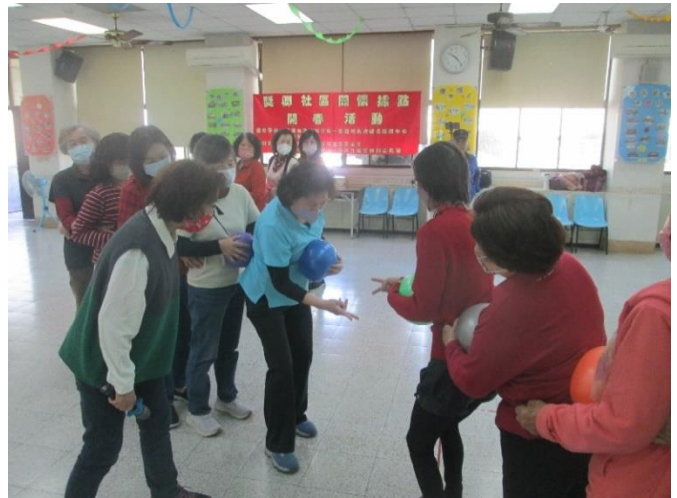
楠梓-關懷據點開春活動