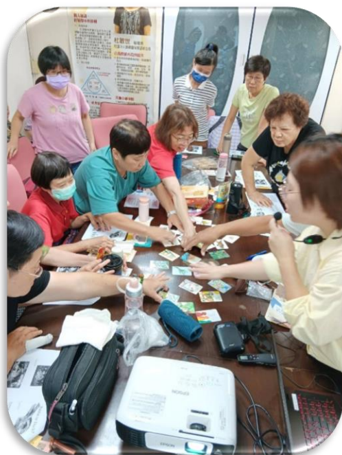
台北居服-心理紓壓卡牌活動