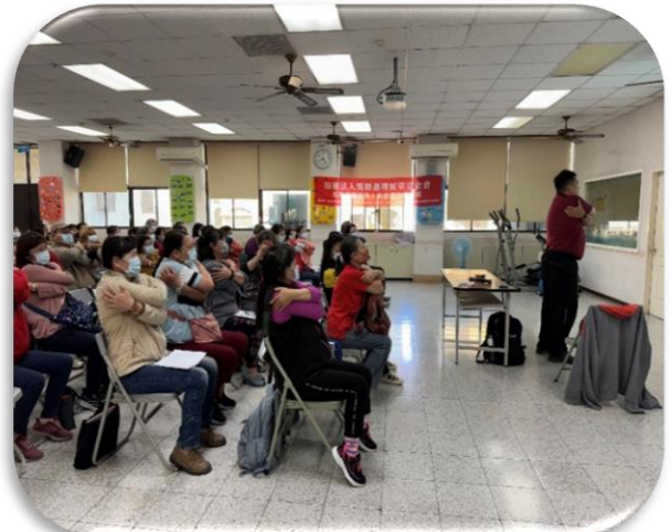
左營居服-徒手移轉位教學