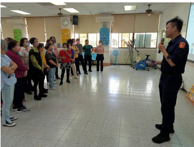
楠梓-高雄市警察局楠梓分局 防詐及交通安全宣導