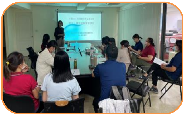
社區整合型服務中心 A 單位 老年人靈性照顧教育訓練