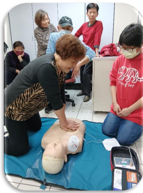
台北居服-急救課程