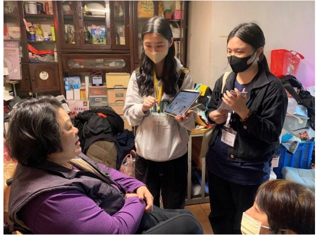
國北護長期照護系實習 (臺北居家服務)