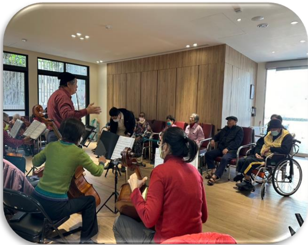
苓雅日照-鳳山長老會樂齡愛樂小組報佳音