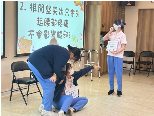
育英醫專學生團體衛教 (高雄護理之家)