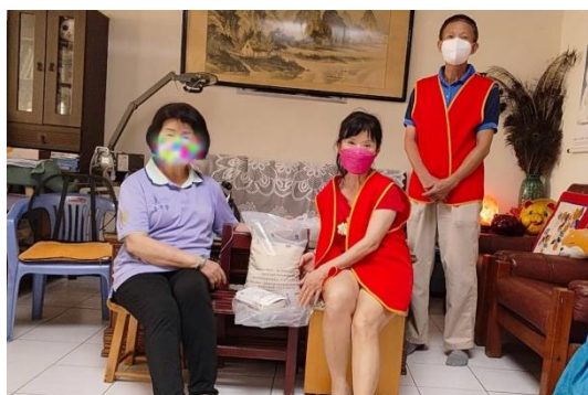
←夫妻志工贈送 獨居老人物資 關懷訪視獨居老人→

夫妻同心做志工，這種攜手合作的默契，讓我們在生活中多了更多理解與包容和共同話題，我深信愛是會傳遞的，我們每付出一份心力，就可能在他人心中的點燃一盞燈，雖然我們的力量有限，但只要願意多一點關懷，長輩就會多一份溫暖。我們會繼續並肩前行，把這份愛與關懷送到更多需要的人心中，讓幸福持續傳遞流轉。