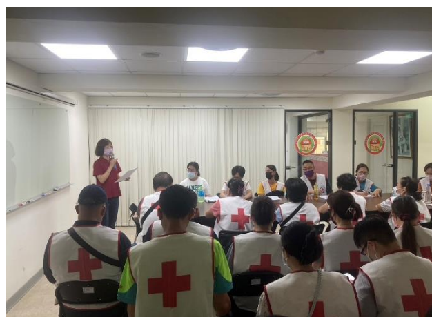
紅十字會照服員實習 (左營居家服務)