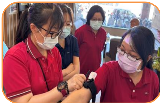
社區整合型服務中心 A 單位 止血帶急救教育訓練