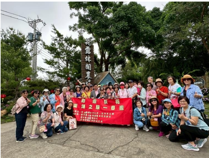
楠梓-彩遊桐花 樂活之旅一日遊 一日遊