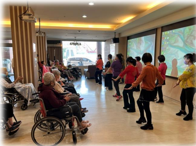
楠梓-志工到護理之家表演活動