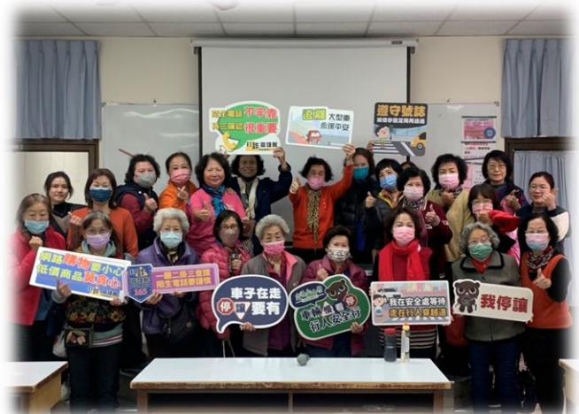
楠梓-楠梓分局銀髮族防詐防宣導