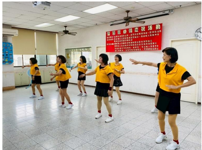
楠梓-「溫馨慈母情」之母親節慶祝活動