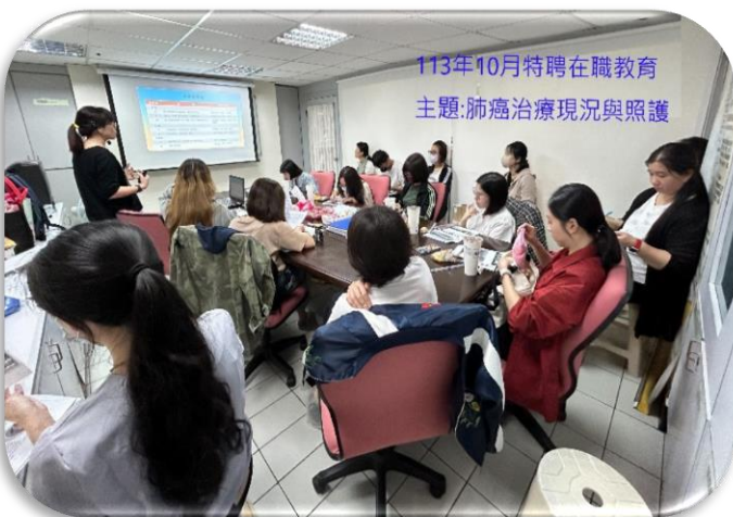
臺北特聘-肺癌治療現況與照護