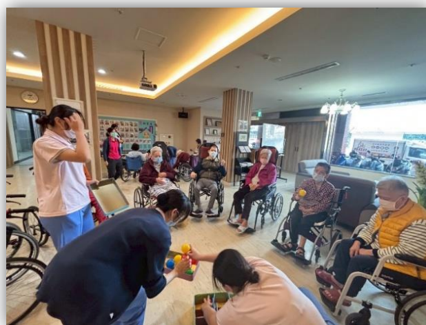
護理之家-保齡球/九宮格丟丟樂