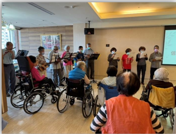
護理之家-七賢禮拜堂表演