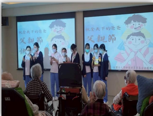
護理之家-父親節活動