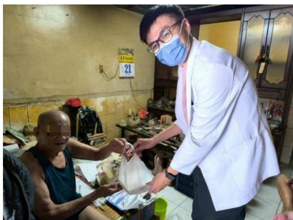
健仁醫院 PGY 訓練 (楠梓服務中心)