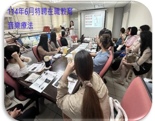
臺北特聘-音樂療法