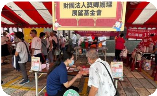
社區整合型服務中心 A 單位_重陽節宣導 擺攤活動