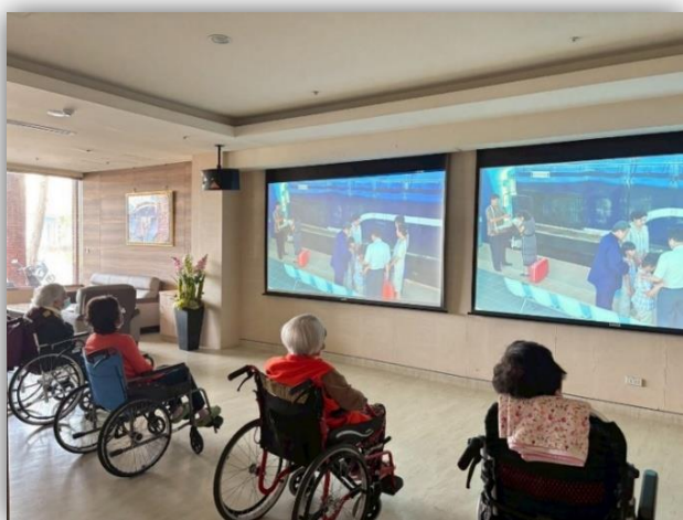
護理之家-電影欣賞活動