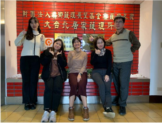
國北護長期照護系實習 (臺北居家服務)