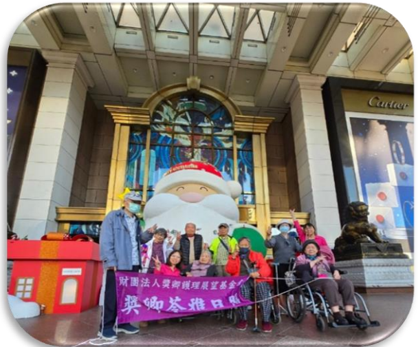
苓雅日照-漢神過聖誕